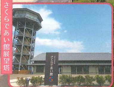
さくらであい館展望塔