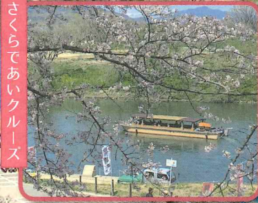
さくらであいクルーズ