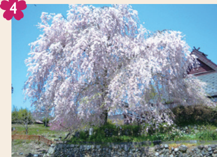
4 円山公園「祇園の夜桜」の子桜 [京北上中町九免状6-3(上中公民館前)]

京都市街から京北トンネルを抜けると、そこは花いっぱいの京北。京北の春はなんといっても桜。注目は「満開の時期が街中より10日ほど遅れてやってくる」ということ。街中で見頃を逃してしまった人も、まだまだたっぷり桜を楽しみたい人もぜひ見に来てね!