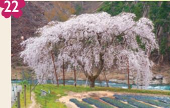
22 魚ヶ淵のシダレザクラ [京北周山町測ノ上42]