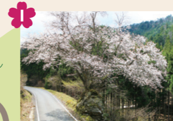
1 知谷の岩抱桜 [京北上弓削町知谷]