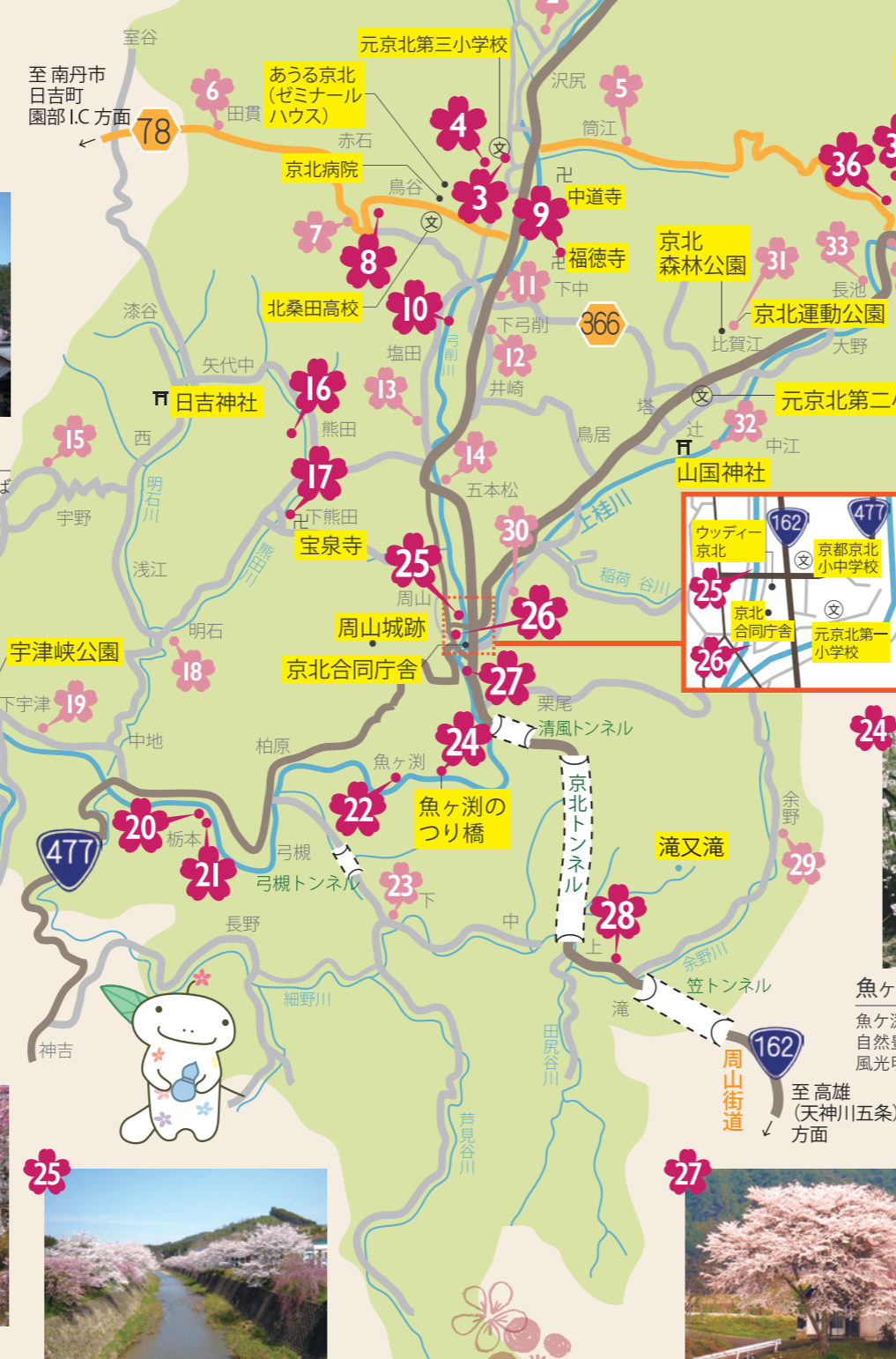
25 寺田橋上流の桜並木 [京北周山町馬場瀬]

桜の木の下に集う人の縁を結ぶと言われる「出逢い桜」。おおらかに枝を広げ、花を咲かせる姿に心とみえます。