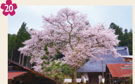
20 玉林寺の一本桜 [京北栃本町西町49(玉林寺)]

寺を訪れる人を迎えるように、寺門前でびのびと大きく枝を広げる、立派な一本桜です。