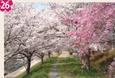
26 紅白桜の並木道 [京北周山町上寺田(京北合同庁舎周辺)]