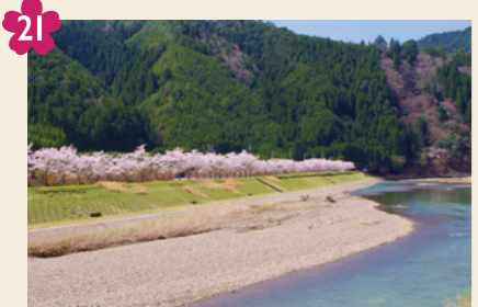
21 栃本の百本桜 [京北栃本町(栃本橋周辺)]

寺を訪れる人を迎えるように、寺門前でびのびと大きく枝を広げる、立派な一本桜です。