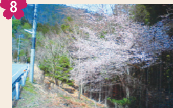
8 船越峠のキンキマメザクラ [京北下中町鳥谷(府道78号線沿い)]