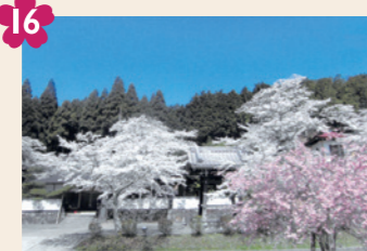
16 東光寺の桜 [京北熊田町宮ノ前4(東光寺)]