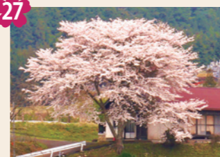
27 出迎え桜 [京北周山町上ヶ市(橋南公民館)]