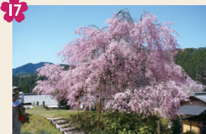
17 宝泉寺のシダレザクラ [京北下熊田町東15(宝泉寺)] 境内の丘に立つ紅しだれ桜。大きく枝を伸ばした桜が咲き誇る姿は迫力満点です。