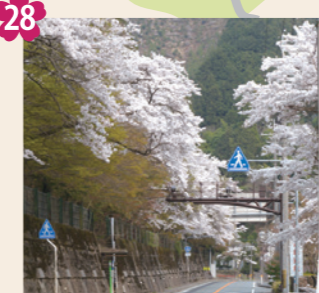
28 細野の桜トンネル [京北細野町中之垣内(笠トンネル周山側)]