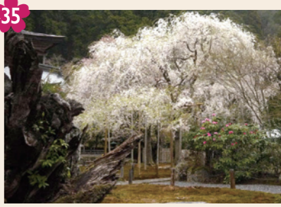
35 常照皇寺の桜 (九重桜、御車返し、左近の桜) [京北井戸町丸山14-6(常照皇寺)] 天然記念物「九重桜」一重と八重が一枝に咲く「御車返し」、御所から株分けされた「左近の桜」と名木揃い。