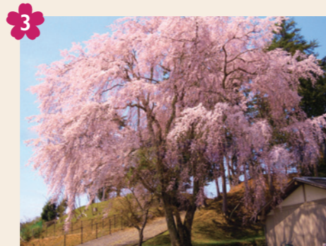
3 出逢い桜 [京北上弓削町弾正42(八幡宮社参道)]

桜の木の下に集う人の縁を結ぶと言われる「出逢い桜」。おおらかに枝を広げ、花を咲かせる姿に心とみえます。