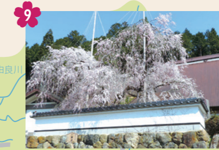
9 福德寺のかすみ桜 [京北下中町寺ノ下15(福德寺)] 樹齢約400年の市指定天然記念物。「かすみ桜」と呼ばれ、お寺から桜越しに街並みを望めます。