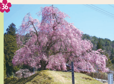
36 常照皇寺山門前のシダレザクラ [京北井戸町丸山] 桜の名所・常照皇寺。その寺門前にも、京北の緑と青空に映える、紅しだれ桜が華麗に花を咲かせます。