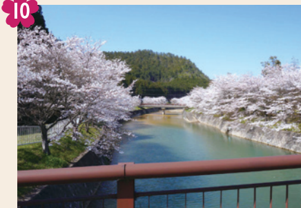
10 矢谷下橋上流の桜並木 [京北下弓削町川ナ辺] 京北の暮らしを支える清流・弓削川。そこにかかる矢谷下橋からは、川面を薄桃色に染める桜並木を一望できます。

民家の庭で桜がのびのびと花を咲かせる京北ならではの風景。円山公園の名木を、桜守「第十五代目佐野藤右衛門」が植樹されたものです。