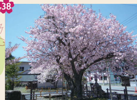
38 黒田の百年桜 [京北宮町宮野90(宮・春日神社)] 春日神社前に佇む樹齢300年超の「黒田百年桜」は、一重と八重が混じり咲く珍種。手鞠のように集まって咲きます。