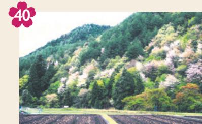
40 吉野山のヤマザクラ群 [京北上黒田町中ヶ谷]