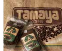
玉屋珈琲店 25日のみ NEW 〈いけ〉