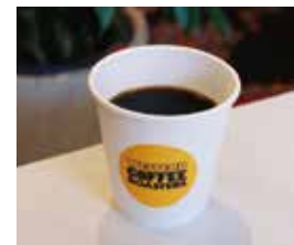
WESTEND COFFEE ROASTERS 26日のみ NEW 〈かわ〉