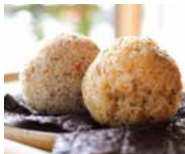
和久里のごはんやおくどさん わっぱ堂 〈かわ〉