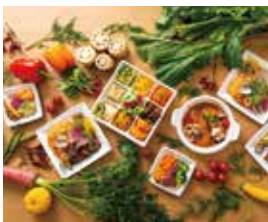
SouZai屋 25日のみ NEW 〈かわ〉