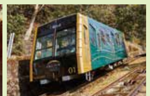
ケーブル比叡駅前ではフォトスポットやかわら投げも