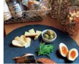
燻製マーケット 25日のみ NEW 〈いけ〉