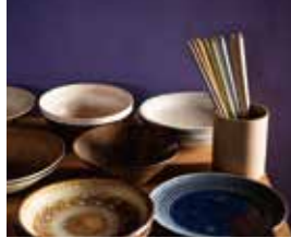
箸蔵 まつかん 〈もり〉