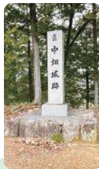
▲中畑城跡(イメージ) ▲八木城本丸跡(イメージ)