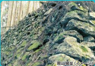
周山城址(イメージ)