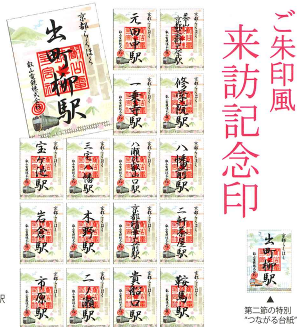
▲令和六年一節「特別ご朱印めぐり」特別“つながる台紙”を使用した「来訪記念印」イメージ

叡山電車の車両、観光列車「ひえい」がもつ、荘厳で神聖な雰囲気イメージした御朱印帳です。「特別ご朱印めぐり」やスタンプ帳、「来訪記念印」の収集にお役立ていただける商品です。