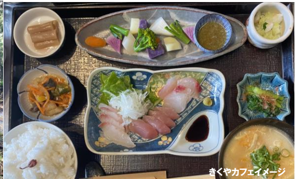
きくやカフェイメージ