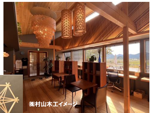
榎村山木工イメージ