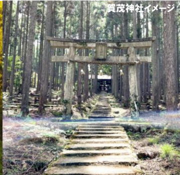
賀茂神社イメージ