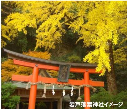
岩戸落葉神社イメージ