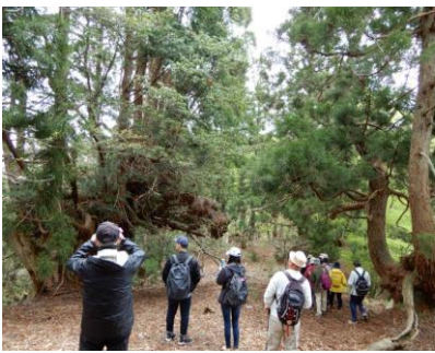
イメージ：アルファトラベル提供