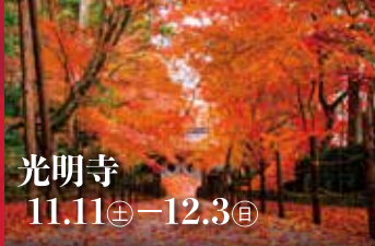
光明寺 11.11(土) - 12.3(日)