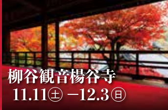
柳谷観音楊谷寺 11.11(土) - 12.3(日)