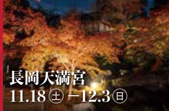
長岡天満宮 11.18(土) - 12.3(日)