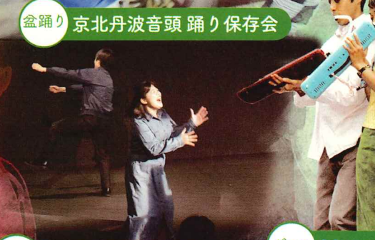
盆踊り 京北丹波音頭踊り保存会