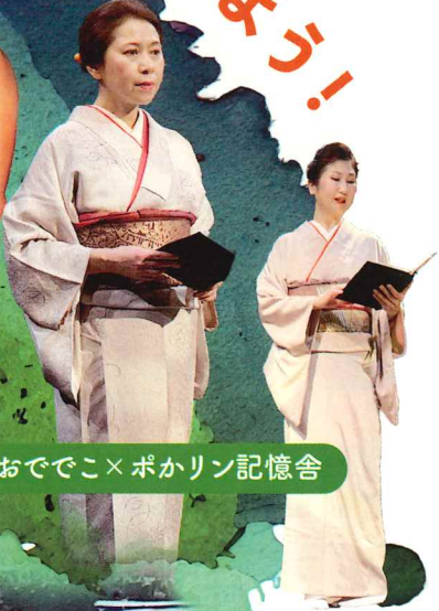
演劇 おでこ×ポカリン記憶舎