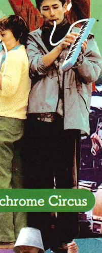
ダンス Monochrome Circus