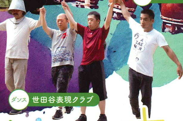
ダンス 世田谷表現クラブ