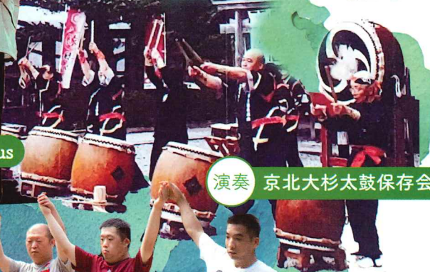
演奏 京北大杉太鼓保存会