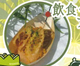
飲食・物販 ブース