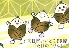
向日市いいところPR隊 「たけのこりん」