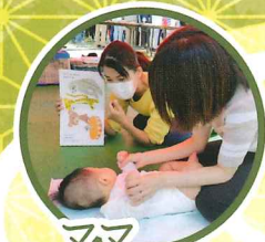
ママ コンシェルジュ

「南福西町(竹林公園前)」下車 東へ徒歩5分 「向日回生病院前」下車 南へ徒歩10分 ▼詳細は中面地図参照