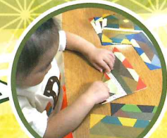
竹紙おりがみ あそび