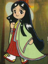
向日市観光協会 マスコットキャラクター 「かぐ歩ちゃん」