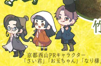
京都西山PRキャラクター 「さい君」「お玉ちゃん」「なり様」