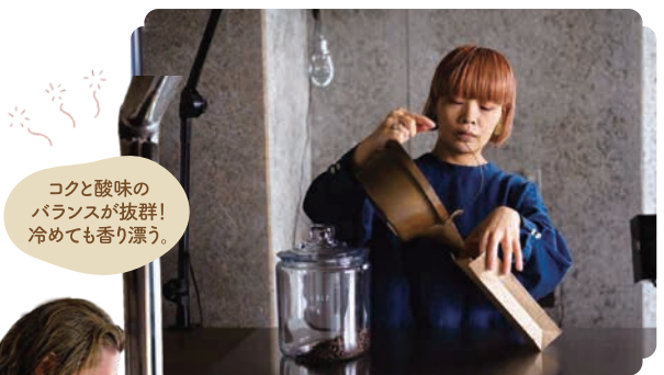
コクと酸味のバランスが抜群! 冷めても香り漂う。

(TEL)075-925-6856 (営業時間)[木・土]10:00~15:00