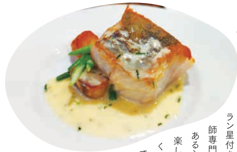
(TEL)075-600-9578 (営業時間)11:30~14:00 17:30~21:30

気取らないフランス料理や、人々の交流を楽しんでいたビストロです。ミシュラン星付きレストランや調理師専門学校講師の経験もあるシェフが作る料理と、楽しい会話をお楽しみください。お子様連れでもOK！お電話かインスタDMにてご予約ください！