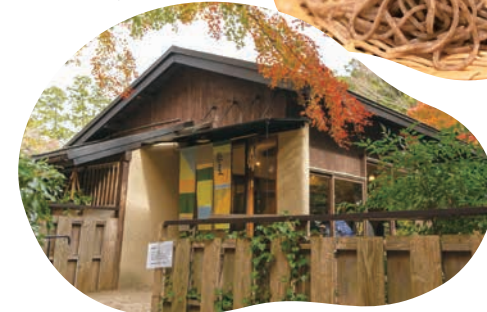
(TEL)075-333-7311 (営業時間)11:00~15:00 ※時期によっては、蕎麦飯や炊き込みご飯の場合あり。