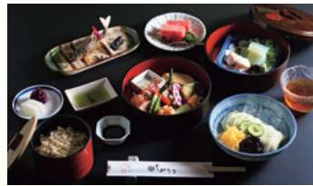
【6月~7月】夏の北山(竹) 5,800円(税込)