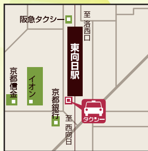
Eコース 集合場所 阪急東向日駅からご乗車の場合