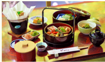
【5月】春の北山(竹) 5,800円(税込)

※お申し込みいただいたお客様全て同じメニューのご提供となります。個別にメニューを選ぶことはできません。※写真はイメージです。