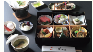
【6月~7月】ミニ懷石 8,300円(税込)

お食事の後、帰路のお時間(15:30)まで、お近くの新緑スポットの散策をお楽しみください。