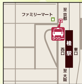
Eコース Fコース 集合場所 阪急桂駅からご乗車の場合