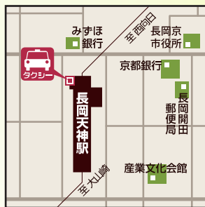
Eコース 集合場所 阪急長岡天神駅からご乗車の場合