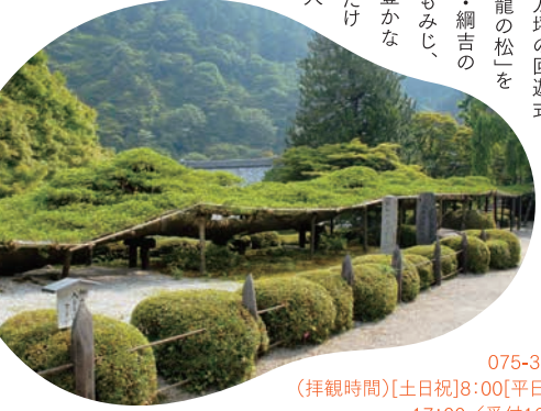
(TEL) 075-331-0020 (拝観時間)[土日祝]8:00[平日]8:30~17:00/受付16:45終了

西国三十三所の第二十番札所で、3万坪の回遊式庭園では、国の天然記念物の「遊龍の松」をはじめ、桂昌院(徳川5代将軍・綱吉の母)お手植えの枝垂れ桜、青もみじ、あじさい、紅葉など色彩豊かな美しい景色をお楽しみいただけます。また、阪神淡路大震災で奇跡的に助かったバスの運転手さんが持っていたことから評判になったおちないお守りも有名です！