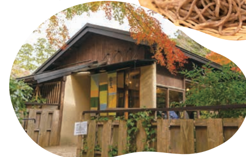
(TEL)075-333-7311 (営業時間)11:00~15:00 ※時期によっては、苜蓿飯や炊き込みご飯の場合あり。