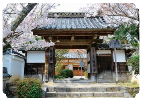
(TEL)075-331-0601 (拝観時間)9:30~16:30/受付16:00終了 ※2月中は拝観休止

百人一首でも有名な歌人、西行法師が出家したお寺。境内には、西行お手植えの「西行桜」があるほか、桜ともみじが約100本ずつ植えられていて、別名「花の寺」と呼ばれています。また、重要文化財の薬師如来像や金剛力士像も間近に見ることが出来ます！