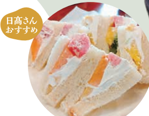
目高さん おすすめ

新鮮で美味しい季節のフルーツが贅沢に使われているフルーツサンド。甘すぎない生クリームもポイントが高いです！テイクアウト（電話注文可）もできる人気商品です。