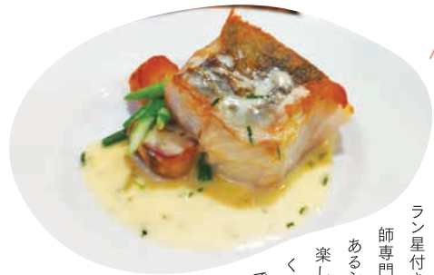
(TEL)075-600-9578 (営業時間)11:30~14:00 17:30~21:30

気取らないフランス料理や、人々の交流を楽しんでいたビストロです。ミシュラン星付きレストランや調理師専門学校講師の経験もあるシェフが作る料理と、楽しい会話をお楽しみください。お子様連れでもOK！お電話かインスタDMにてご予約ください！