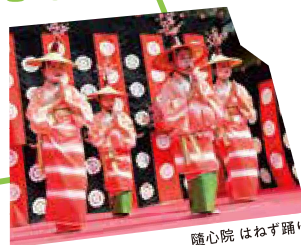
随心院 はねず踊り