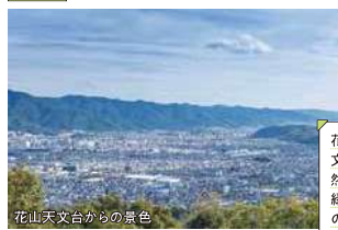
花山天文台からの景色