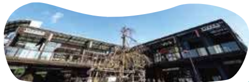
山科駅前「ピエラ山科」