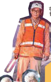
夜の見回り 銀河隊