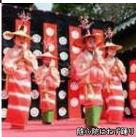
随心院はねず踊り