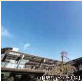
山科駅前「ビエラ山科」