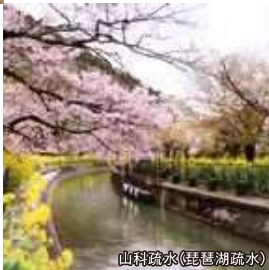
山科疏水(琵琶湖疏水)