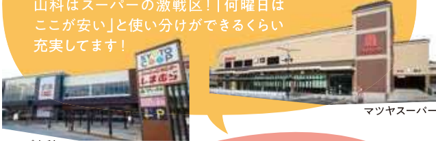
コープ山科 新十条

山科はスーパーの激戦区!「何曜日はここが安い」と使い分けができるくらい充実しています!