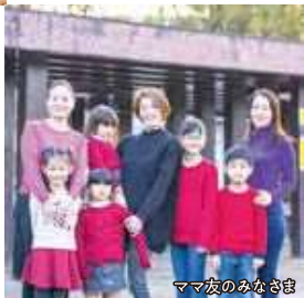
ママ友のみなさま