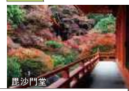
観光客にも人気の高い寺院。境内や参道が真っ赤な紅葉で彩られた風景は圧巻。四季と歴史に触れる趣のある暮らしは京都ならではの。