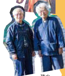
疏水 ボランティアの方

「街の子を守るんが使命」と語る夜の見回り銀河隊や、疏水沿いの綺麗な菜の花の世話をするボランティアの方など、区民みんなで山科を住みよい街にしています!