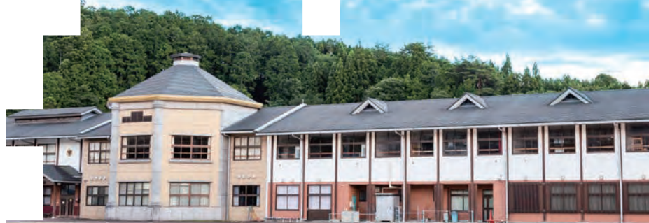
※掲載写真は全てイメージです。