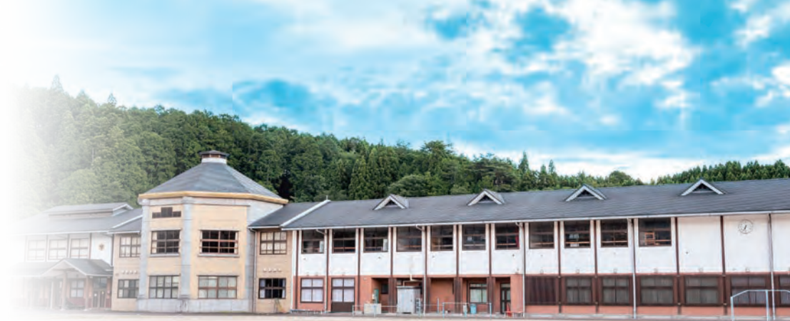
※掲載写真は全てイメージです。