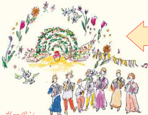
ガーデン ミュージアム比叡

ガーデンミュージアムや 比叡山延暦寺へは、 お得なチケットを販売！ 詳細は裏面に。